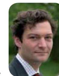
CEO Stefaan Vandaele

toenemende vraag naar biomassa. Kortom vandaag is de beschikbaarheid aan schors teruggevallen op een niveau van ongeveer 40% van de beschikbare schors van 2 jaar geleden. De effecten van de schaarste op onze business zijn niet te overzien. Enerzijds heeft de sector te kampen met belangrijke stockbreuken, anderzijds bewijzen de klassieke economische wetten (toenemende vraag + beperkt aanbod = sterk stijgend prijs) nogmaals hun waarde. Deze effecten zullen zich nog verschillende jaren laten voelen. De situatie voor het volgende seizoen zal vermoedelijk nog nijpender zijn gezien alle voormalige stocks ondertussen zijn opgewerkt. Darwin indachtig heeft Peltracom de voorbije maanden hard gewerkt aan het uitbreiden van het aanbod aan alternatieve bodembedekkers: gaande van kokoschips, gekleurde houtsnippers, tot kleikorrels en pouzolaan. We geven u hieromtrent graag bijkomende informatie