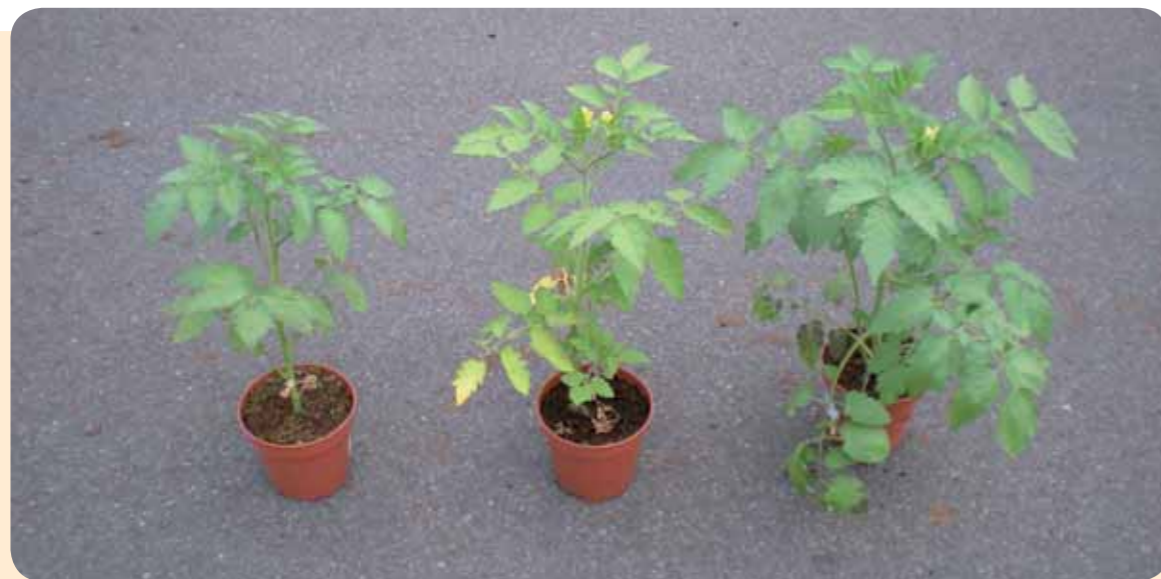
Foto 1 Tomaten opgegroeid in potgrond aangerijkt met chemische bemesting (links), in een standaard biopotgrond (midden) en in een Peltracom biopotgrond (rechts)

Het R & D team van Peltracom heeft eveneens een biopotgrond ontwikkeld voor het vullen van bloembakken en hangende baskets. Deze potgrond, de BIOFLEUR bevat hernieuwbare grondstoffen, een biologische wetting agent en organische meststoffen voor 100 dagen. De BIOFLEUR is een zeer luchtige potgrond waarin planten gemakkelijk wortelen. Bovendien is deze potgrond verpakt in een biodegradeerbare zak van 70L.