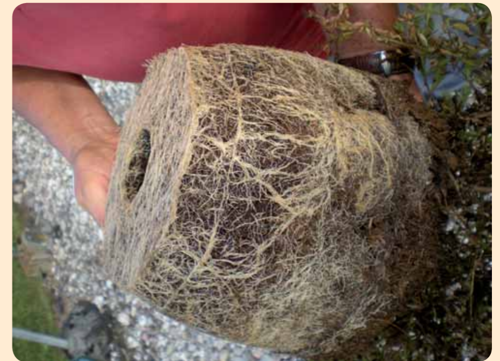
Figuur 2 De Peltracom biopotgrond voor de bebloeming van steden en gemeenten

Referentie van biosubstraten: 103BIO, 136BIO, 106BIO, 113BIO, 119BIO, BIOFLEUR, BIONATURE